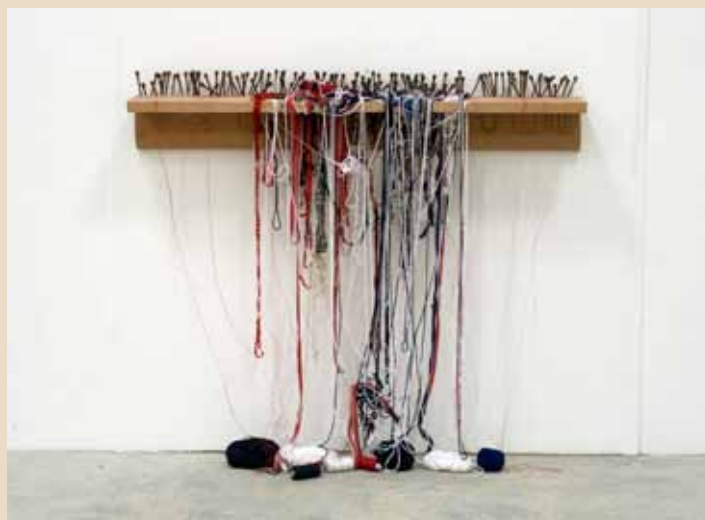
'Trapped' (detail) • 120 x 80 x 20 cm • detail van installatie 'Apuku Return' • 2011 mixed media

een Surinaams onafhankelijkheidsstrijder. De installatie laat zien hoe twee figuren die in ons gedeelde verleden tegengestelde opvattingen vertegenwoordigden via hun nazaten gekoppeld kunnen worden. Op deze manier maakt Remy Jungerman het gedeelde slavernijverleden bespreekbaar.