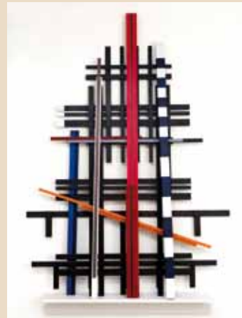
'Voices of Babel' • 2013 geschilderd hout • 154 x 104 x 16 cm