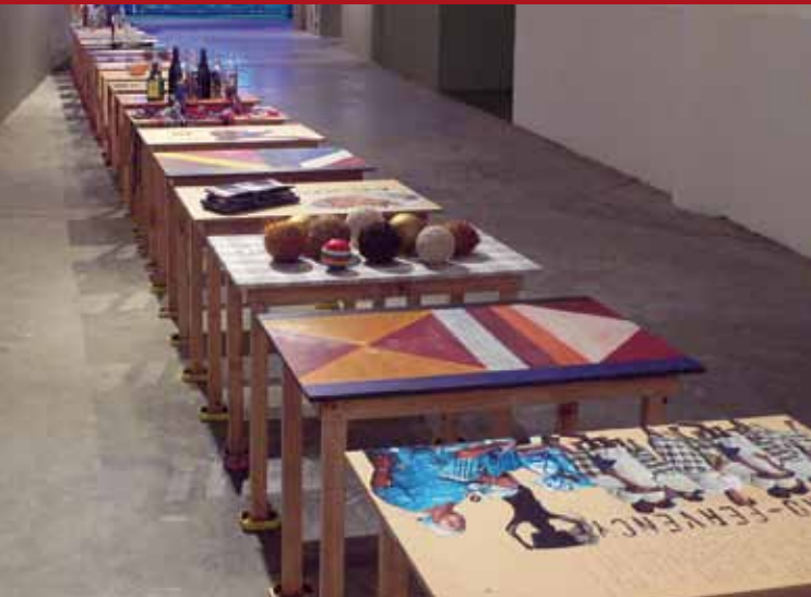
'Travelers Panama' • 2005-2013 • mixed media • 1800 x 81 x 97 cm

In de herfst staat de Kunstvereniging volledig in het licht van mythe en mystiek. Alle deelnemende kunstenaars zullen hun visie, geschiedenis of andere mogelijke relaties met betrekking tot het onderwerp tentoonstellen aan de hand van hun werken.