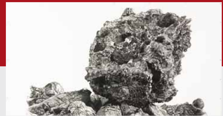
Erik Odijk • 'Bomba' • houtskool op papier • 196 x 366 cm