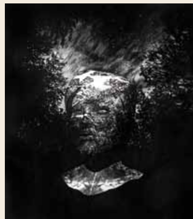
'Head' • 2013 • 57 x 50 cm grafiet op papier

Tijdens de expositie biedt de Kunstvereniging een speciale editie aan van Thijs Zweers. Deze bijzondere litho's zijn in beperkte oplage (40) verkrijgbaar voor de prijs van € 150,- (leden 10% korting).