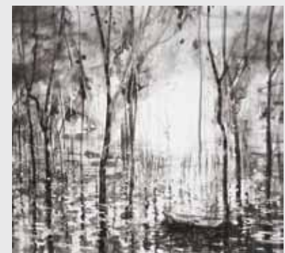
Nik Christensen • '11- slow approach' 2008 • inkt op papier • 230 x 250 cm